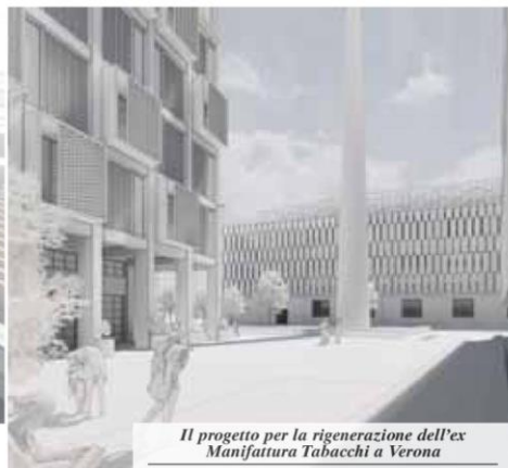
Il progetto per la rigenerazione dell'ex Manifattura Tabacchi a Verona