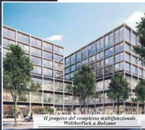
Il progetto del complesso multifunzionale WaltherPark a Bolzano